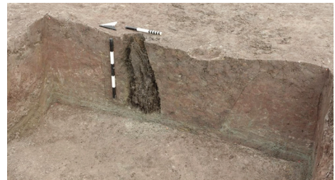
Abb. 37 Pfosten, Befund 252 in Pfostengrube 253 und kleiner, schon entnommener Mulde 251, in Profil 25 (Fälldatum 1128 ± 6 n. Chr.).

Eine spätmittelalterliche unglasierte Schmuckkachel-Fragment mit Meerweibchendarstellung (Spätmittelalter 1300-1500)