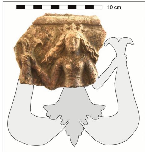
Abb. 33 Schmuckkachel mit Abbildung einer Meerfrau aus dem Brandschutthorizont des jüngeren, spätmittelalterlichen Gebäudes, Befund 24 (Rekonstruktion Rita Beigel).

der ganze Dorfplatz wurde angehoben, damit wir so wenig wie möglich in den Boden eingreifen mussten. Ohne zu sehr in Detail zu gehen, möchte ich zwei Punkte herausgreifen: