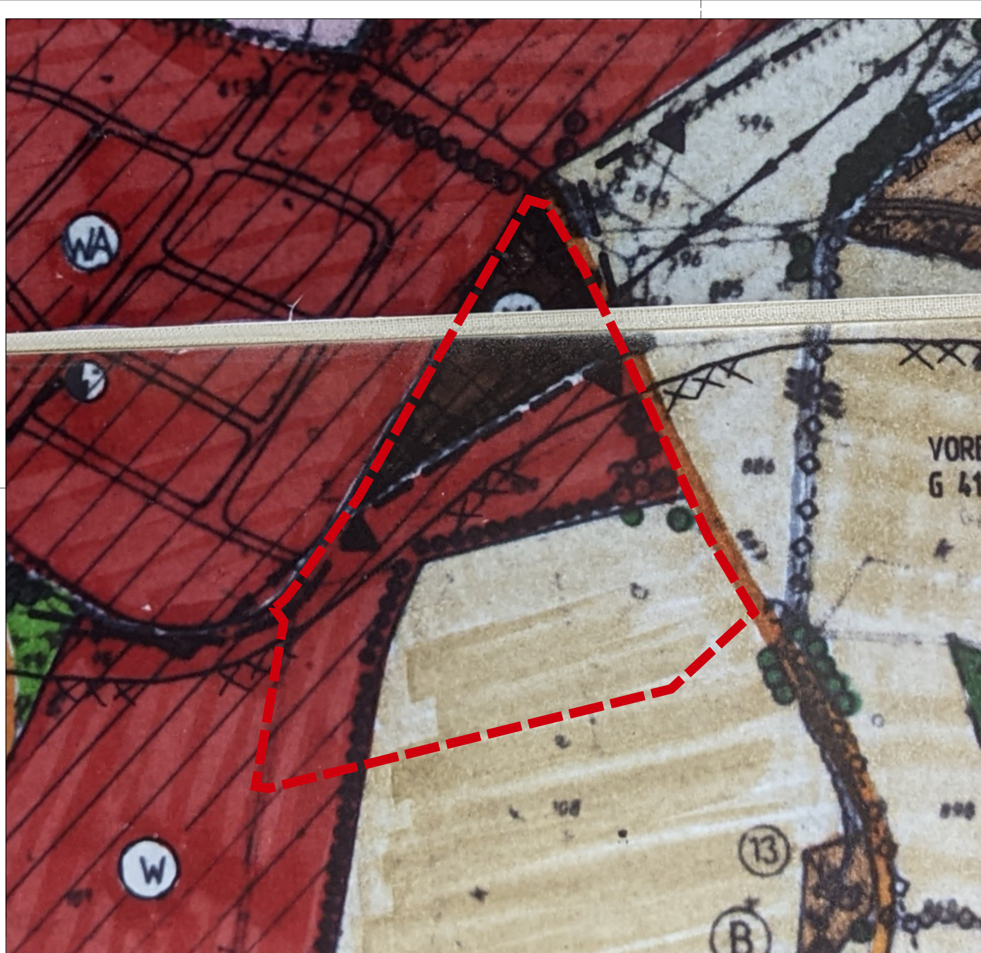
Flächennutzungsplan mit Landschaftsplan der Gemeinde Neusitz, Urplan ohne nachfolgende Änderungen, in Kraft getreten: 07.05.1993, Ausschnitt, M. 1:2000